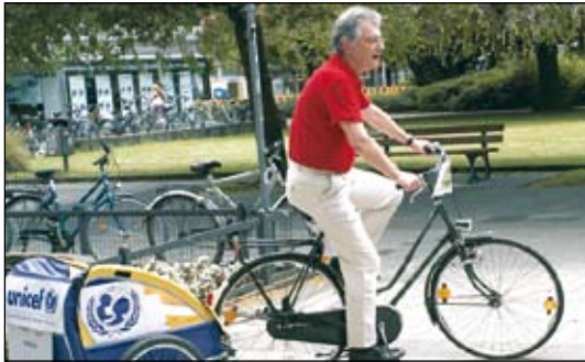
Foto: Christoph Strässer bei der Spendenaktion „24 Stunden Radfahrt“ rund um die Promenade.

des früheren UNICEF-Geschäftsführers und der Neuwahl des Vorstandes begonnene Neuanfang „verdient jedes Vertrauen“, so Strässer. „In der Diskussion um die Praktiken des früheren Geschäftsführers drohte die große Leistung und das außerordentliche Engagement der Ehrenamtlichen vor Ort unterzugehen“, erklärte Strässer. Der Abgeordnete, der Sprecher für Menschenrechte und humanitäre Hilfe der SPD-Bundestagsfraktion ist, würdigte besonders die Hilfe, die UNICEF mit einem Projekt für Kinder im immer noch hilfebedürftigen ehemaligen Burma, dem heutigen Myanmar, leistet. Mit dem Projekt „Zurück in die Schule“ werden Notschulen errichtet. Strässer rief die Bürgerinnen und Bürger von Münster auf, für dieses Projekt von UNICEF zu spenden. „Ihr Geld kommt garantiert an und hilft den Kindern in Burma“, so Strässer und fügte hinzu: „Wahrscheinlich wird derzeit kein anderes Hilfswerk so kontrolliert wie UNICEF“.